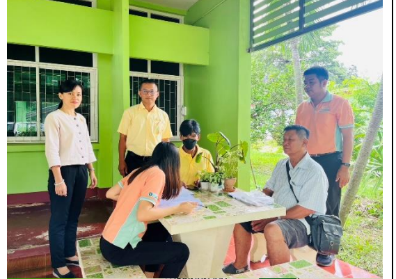
ถ่ายทอดความรู้จากคิด วิเคราะห์ และกำหนดแนวทาง ในการแก้ไขปัญหาในชุมชนด้วยตนเอง