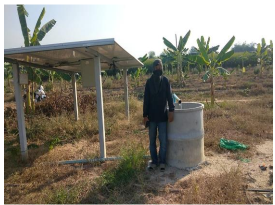
บ่อบาดาลเพื่อการเกษตร บ่อที่ ๑๔