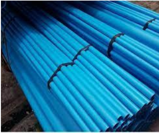
๓. ท่อ PVC สีฟ้า ขนาด ๒ นิ้ว มอก. จำนวน ๕๙๑ ท่อน