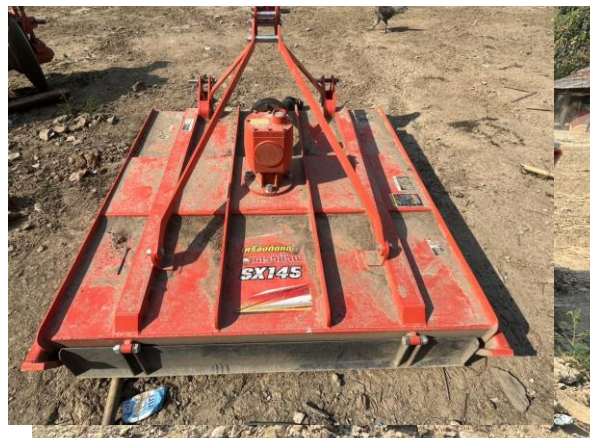
๒.๒ ผานพรวน ชนิด ๖ ใบ งานผานขนาดไม่น้อย กว่า ๒๔ นิ้ว จำนวน ๑ ชุด