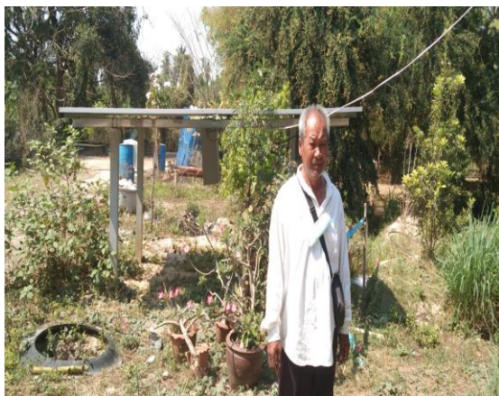
บ่อบาดาลเพื่อการเกษตร บ่อที่ ๓