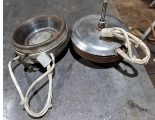
๕.๔ ฮีตเตอร์ชุดแม่พิมพ์