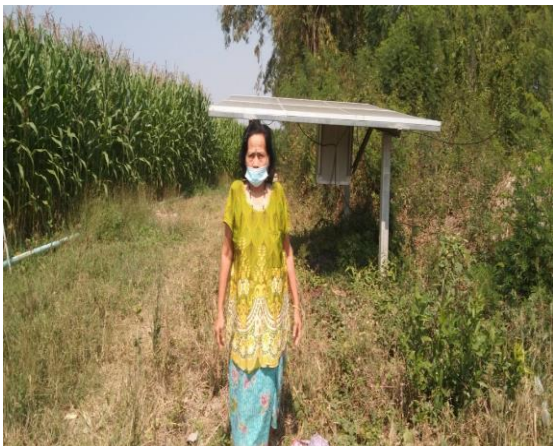
บ่อบาดาลเพื่อการเกษตร บ่อที่ ๙