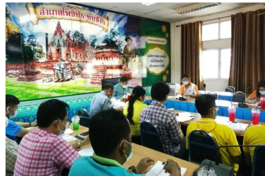
ภาพการประชุมเพื่อพิจารณาให้ความเห็นชอบคณะกรรมการบริหารโครงการฯ ระดับอำเภอ

** หากมีการประชุมมากกว่า ๒ ครั้ง ให้ระบุภาพ ว่าเป็นการประชุม ครั้งที่ ๑ / ครั้งที่ ๒ **