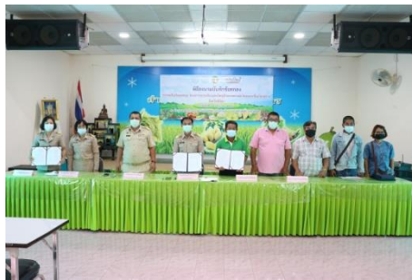
ภาพพิธีลงนามบันทึกข้อตกลงการขอรับเงินอุดหนุนโครงการฯ

วันที่ ๑๔ มิถุนายน ๒๕๖๔ ณ ห้องประชุมสำนักงานเกษตรจังหวัดพิจิตร อำเภอเมืองพิจิตร จังหวัดพิจิตร