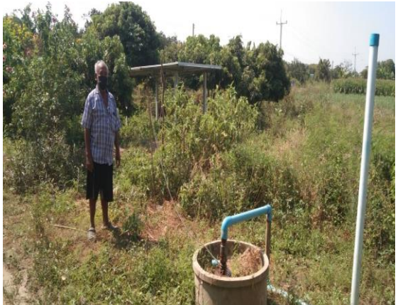
บ่อบาดาลเพื่อการเกษตร บ่อที่ ๘