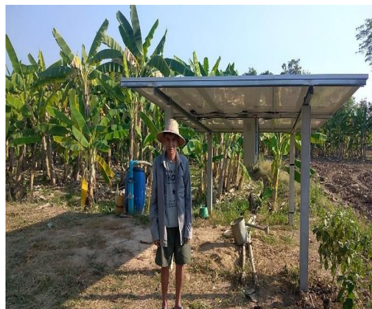
บ่อบาดาลเพื่อการเกษตร บ่อที่ ๑๕