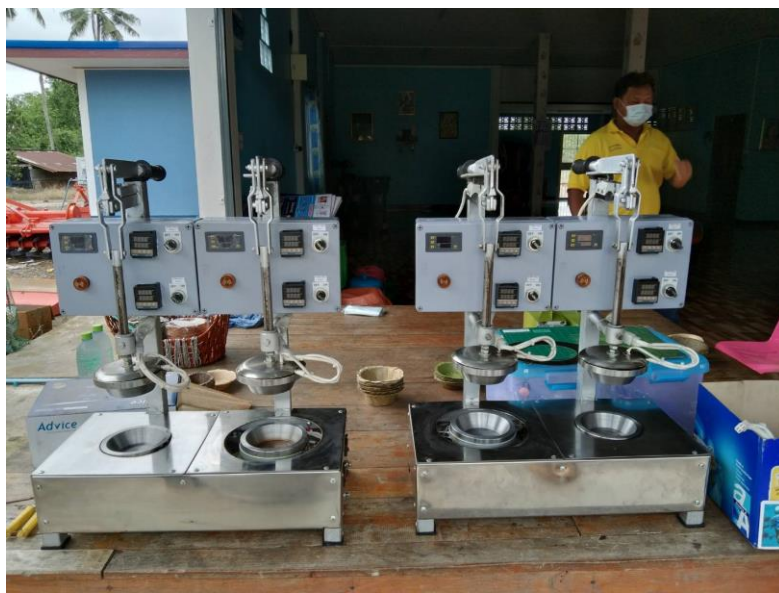
๕. เครื่องอัดภาชนะจากใบไม้ แบบสองหัวกด รองรับการเปลี่ยนแม่พิมพ์ได้หลายแบบ พร้อมชุดแม่พิมพ์แบบ ถ้วย ขนาด ๑๒ ซม. ลึก ๓ ซม. พร้อมฮีตเตอร์ จำนวน ๒ เครื่อง