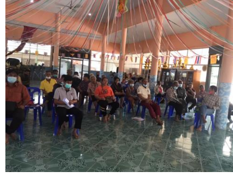
ภาพเวทีการทบทวนกิจกรรมในโครงการฯ

๒. คณะกรรมการบริหารโครงการฯ กระดับแปลงใหญ่ด้วยเกษตรสมัยใหม่และเชื่อมโยงตลาดระดับอำเภอ พิจารณาให้ความเห็นชอบ