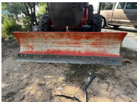
จำนวน ๑ ชุด