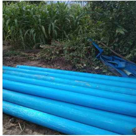
๔. ท่อ PVC สีฟ้า ขนาด ๔ นิ้ว มอก. จำนวน ๑๒ ท่อน