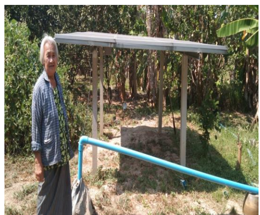
บ่อบาดาลเพื่อการเกษตร บ่อที่ ๔