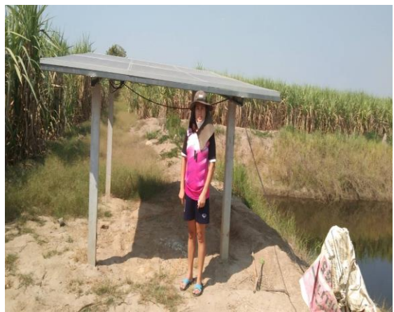
บ่อบาดาลเพื่อการเกษตร บ่อที่ ๑๐