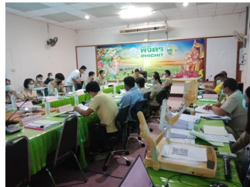
ภาพการประชุมเพื่อพิจารณาให้ความเห็นชอบคณะกรรมการบริหารโครงการฯ ระดับจังหวัด ครั้งที่ ๑ วันที่ ๑๙ เมษายน ๒๕๖๔ ณ ห้องประชุมสำนักงานเกษตรจังหวัดพิจิตร อำเภอเมืองพิจิตร จังหวัดพิจิตร