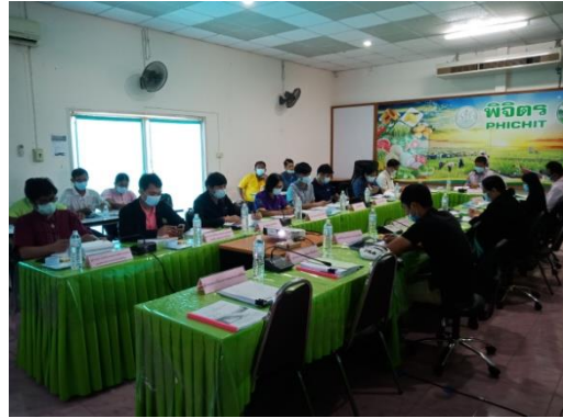
ภาพการประชุมเพื่อพิจารณาให้ความเห็นชอบคณะกรรมการบริหารโครงการฯ ระดับจังหวัด ครั้งที่ ๒ วันที่ ๒๐ เมษายน ๒๕๖๔ ณ ห้องประชุมสำนักงานเกษตรจังหวัดพิจิตร อำเภอเมืองพิจิตร จังหวัดพิจิตร

๔. พิธีลงนามบันทึกข้อตกลงการขอรับเงินอุดหนุนโครงการยกระดับแปลงใหญ่ด้วยเกษตรสมัยใหม่และเชื่อมโยงตลาด วันที่ ๑๔ มิถุนายน ๒๕๖๔ ณ ห้องประชุมสำนักงานเกษตรจังหวัดพิจิตร อำเภอเมืองพิจิตร จังหวัดพิจิตร