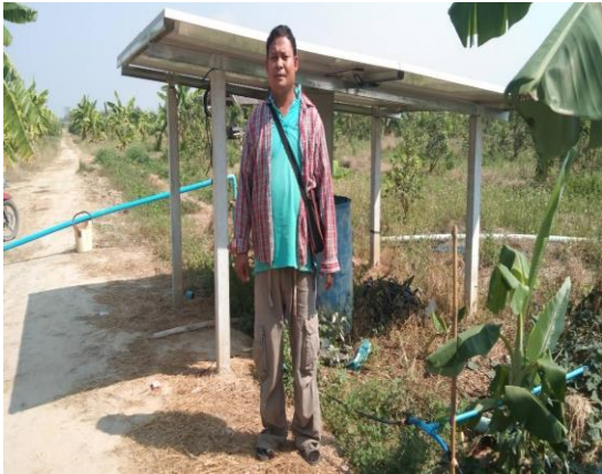
บ่อบาดาลเพื่อการเกษตร บ่อที่ ๗