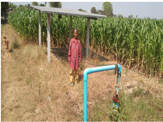
บ่อบาดาลเพื่อการเกษตร บ่อที่ ๑๓