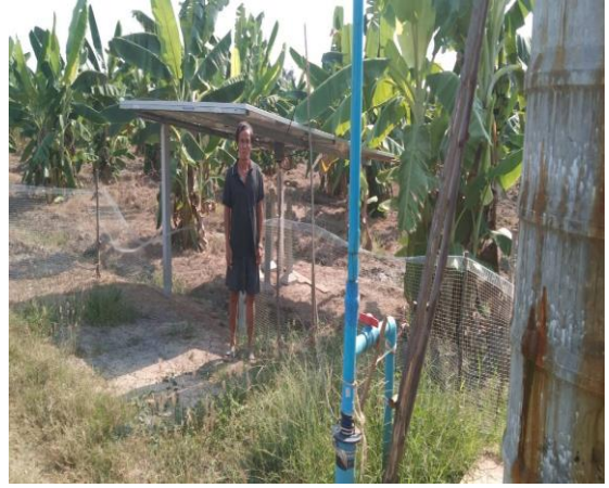
บ่อบาดาลเพื่อการเกษตร บ่อที่ ๖