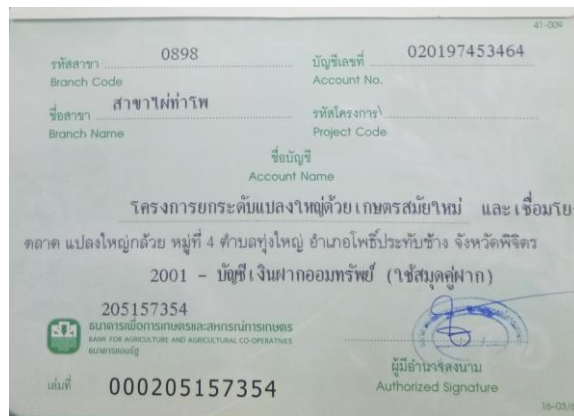
ภาพสำเนาหน้าสมุดบัญชีเงินฝากธนาคาร