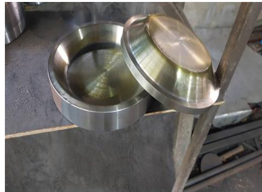
๕.๒ แม่พิมพ์แบบถ้วย ขนาด ๑๘ ซม. ลึก ๓ ซม. (สำหรับกาบกล้วย) พร้อมฮีตเตอร์ จำนวน ๑ ชุด