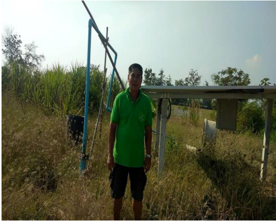
บ่อบาดาลเพื่อการเกษตร บ่อที่ ๑๑