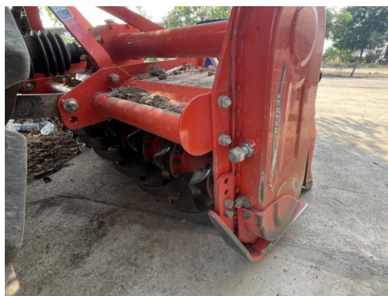
๒.๔ เครื่องตัดหญ้าติดท้ายรถแทรกเตอร์ จำนวน ๑ เครื่อง