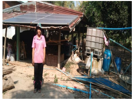
บ่อบาดาลเพื่อการเกษตร บ่อที่ ๒