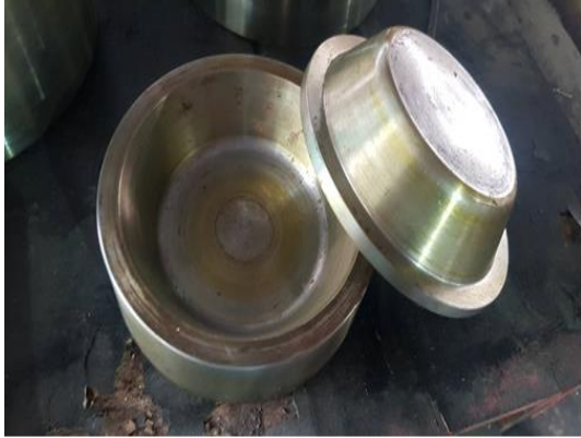
๕.๓ แม่พิมพ์ แบบถ้วย ขนาด ๑๕ ซม. ลึก ๔ ซม.