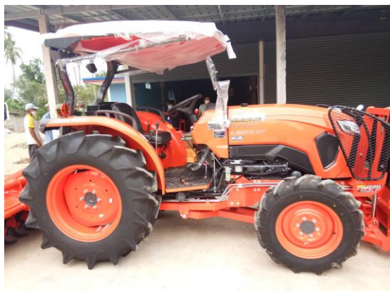
๒.๑ รถแทรกเตอร์ ขนาดไม่น้อยกว่า ๕๐ แรงม้า จำนวน ๑ คัน