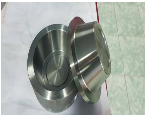
๕.๑ แม่พิมพ์แบบถ้วย ขนาด ๑๒ ซม. ลึก ๔.๕ ซม. พร้อมฮีตเตอร์ จำนวน ๑ ชุด