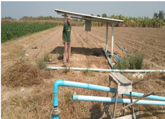
บ่อบาดาลเพื่อการเกษตร บ่อที่ ๑