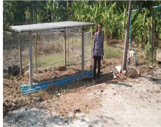
บ่อบาดาลเพื่อการเกษตร บ่อที่ ๑๒