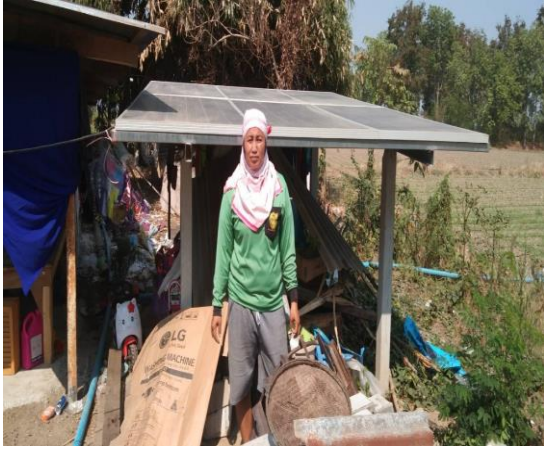
บ่อบาดาลเพื่อการเกษตร บ่อที่ ๕