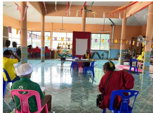
ภาพการติดตามให้คำแนะนำ กำกับการดำเนินงาน และสรุปผลการดำเนินงาน