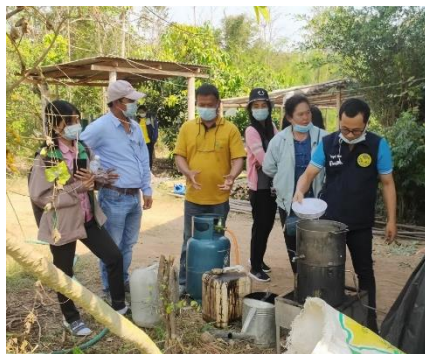
ภาพที่ ๑๖ ปีงบประมาณ ๒๕๖๔ สมาชิกกลุ่มแปลงใหญ่พืชผัก ฯ ไปศึกษาดูงาน ณ ศูนย์การเรียนรู้เศรษฐกิจพอเพียงบ้านวังร่อง บ้านเลขที่ ๕๔/๑ บ้านวังร่อง หมู่ที่ ๕ ตำบลห้วยไร่ อำเภอลำสนัก เพชรบูรณ์