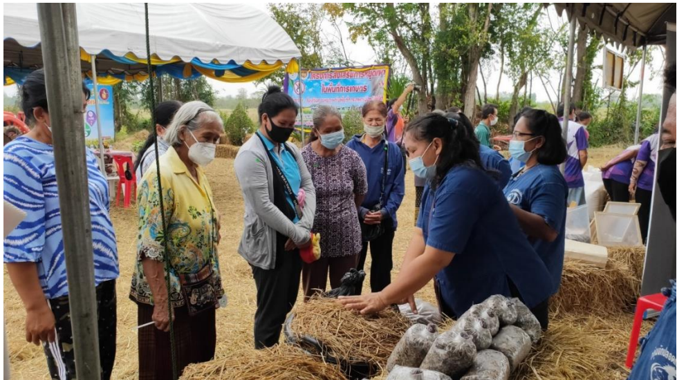
ภาพที่ ๕ กลุ่มแปลงใหญ่พืชผัก ฯ เป็นวิทยากรสาธิตการเพาะเห็ดฟาง ในโครงการส่งเสริมการหยุดเผาในพื้นที่ การเกษตร ประจำปี ๒๕๖๔