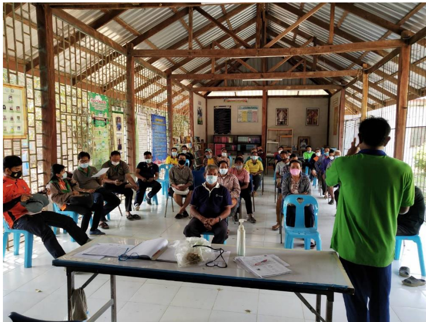
ภาพที่ ๑ การประชุมสามัญประจำปี ๒๕๖๔ ณ ที่ทำการกลุ่มแปลงใหญ่ ฯ หมู่ที่ ๒ ต.ห้วยแก้ว อ.บึงนาราง จ. พิจิตร