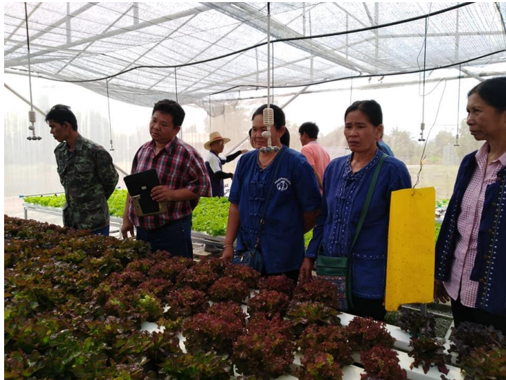
ภาพที่ ๑๕ ปีงบประมาณ ๒๕๖๓ สมาชิกกลุ่มแปลงใหญ่พืชผัก ฯ ไปศึกษาดูงาน ตามโครงการโครงการยกระดับคุณภาพมาตรฐานสินค้าเกษตร ณ สวนผักไฮโดรโปนิคส์ แมล่อน ต.สมอแข อ.เมืองพิษณุโลก จ.พิษณุโลก