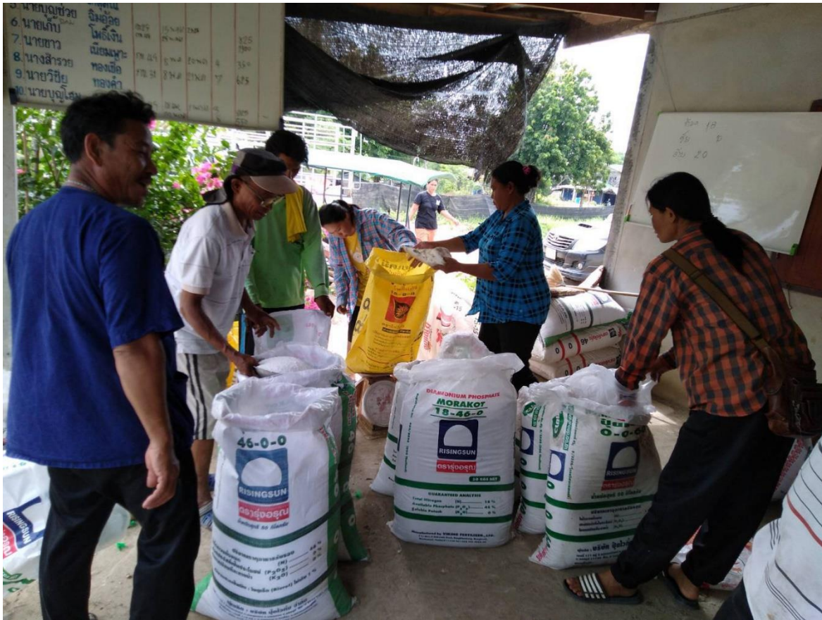
ภาพที่ ๙ สมาชิกแปลงใหญ่พืชผัก ฯ ร่วมกันผสมปุ๋ยสั่งตัด ตามค่าวิเคราะห์ดิน และแจกจ่ายให้สมาชิกในกลุ่มใช้