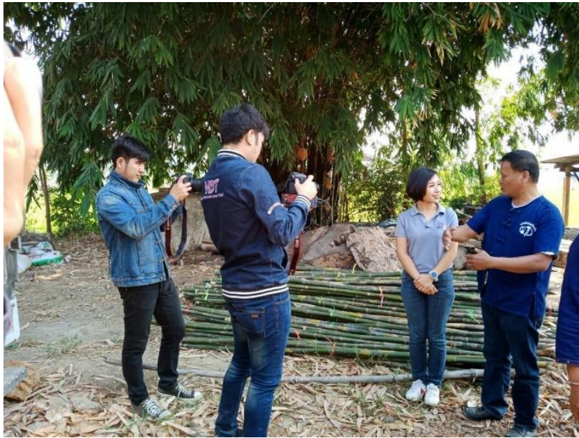
ภาพที่ ๗ ประธานกลุ่มแปลงใหญ่พืชผัก ฯ ถ่ายทำรายการเพื่อสาธิตการใช้สารชีวภัณฑ์ในการควบคุมโรคและแมลงศัตรูพืช