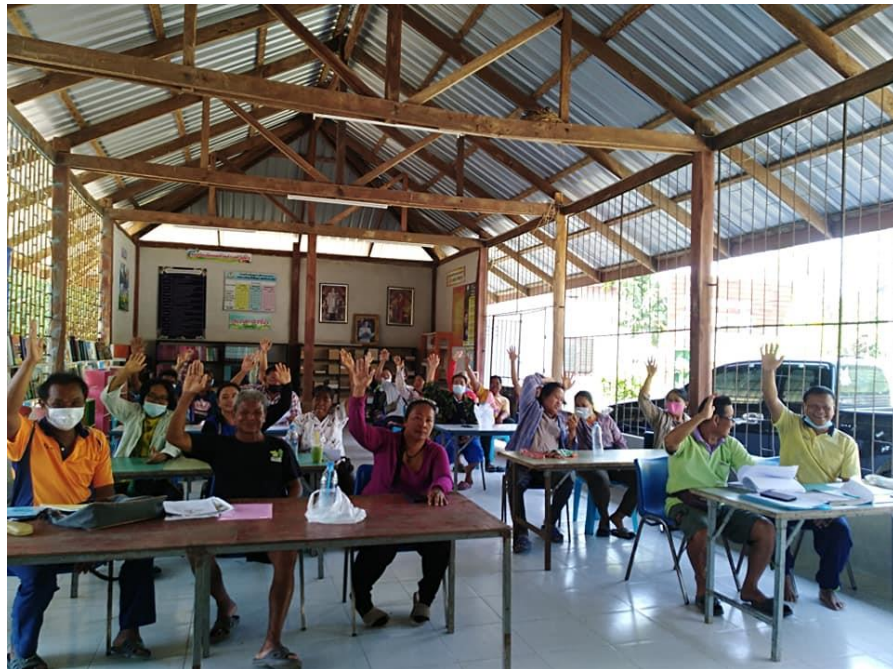
ภาพที่ ๑๘ สมาชิกแปลงใหญ่พืชผัก ฯ มีมติจัดตั้งบริษัท ผักโยแก้ว จำกัด และทบทวนกิจกรรมเพื่อรองรับงบประมาณสนับสนุนโครงการยกระดับแปลงใหญ่ด้วยเกษตรสมัยใหม่และเชื่อมโยงตลาด