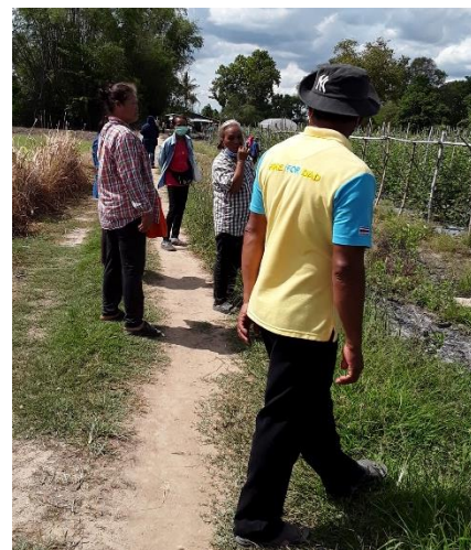
ภาพที่ ๑๐ กลุ่มแปลงใหญ่พืชผัก ฯ เป็นจุดศึกษาดูงานให้แก่เกษตรกร ต.นายาง อ.พิชัย จ.อุตรดิตถ์ (ก.) และเกษตรกรที่อบรมโครงการพัฒนาเกษตรกรปราดเปรื่อง Smart Farmer ปี ๒๕๖๓ โดยสำนักงานเกษตรจังหวัดพิจิตร (ข.)