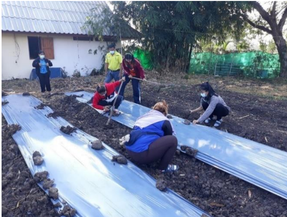
ภาพที่ ๔ กลุ่มแปลงใหญ่พืชผัก ฯ ร่วมวางแผนการ และเป็นพี่ปรึกษาการปลูกพืชปลอดสารพิษ ในพื้นที่ ศพก. อำเภอบึงนาราง ให้แก่ผู้รับจ้างงานโครงการ ๑ ตำบล ๑ กลุ่มเกษตรกรทฤษฎีใหม่