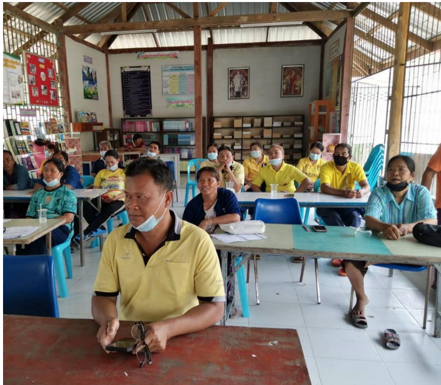
ภาพที่ ๒ ประชุมเพื่อจัดทำแผนการผลิตรายกลุ่มและแผนการผลิตรายบุคคล IFPP ก่อนฤดูการผลิต โดยมีเจ้าหน้าที่จากสำนักงานเกษตรอำเภอบึงนารางเป็นที่ปรึกษา