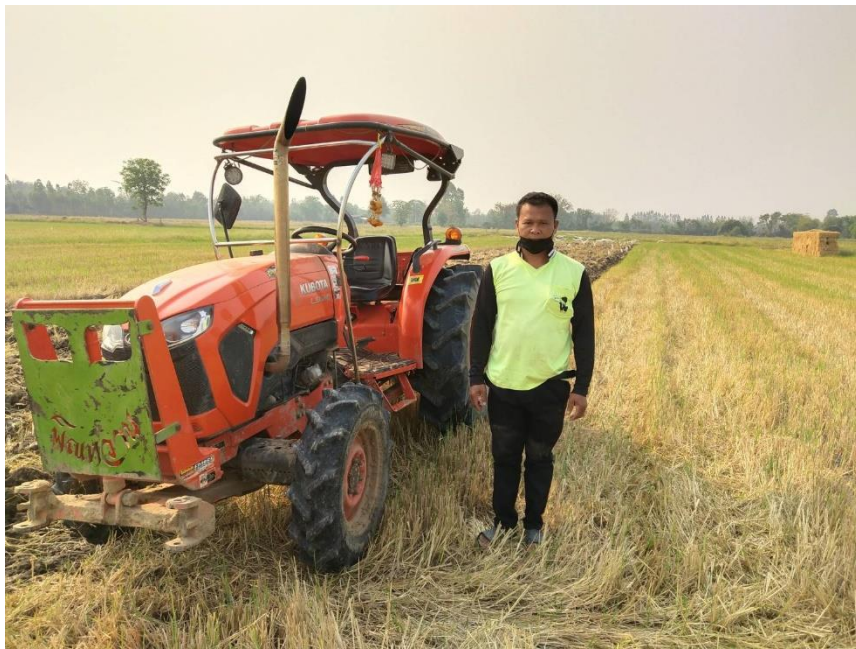
ภาพที่ ๒ กลุ่มแปลงใหญ่พืชผัก ฯ สาธิตการไถกลบตอซังแทนการเผาในพื้นที่การเกษตร ประจำปีงบประมาณ ๒๕๖๔