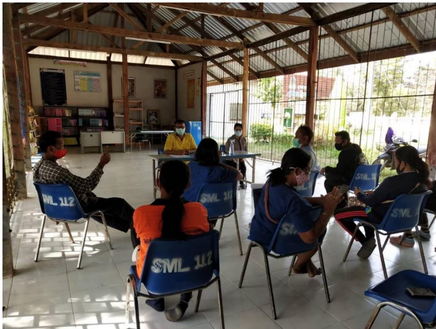
ภาพที่ ๑๗ สมาชิกแปลงใหญ่พืชผัก ฯ ร่วมกันวางแผนการพัฒนาคุณภาพผลผลิต โดยการกำหนดเป้าหมายให้สมาชิกได้รับการรับรองการปฏิบัติทางการเกษตรที่ดีสำหรับพืชอาหาร มกษ.๙๐๐๑-๒๕๕๖ ประจำปี ๒๕๖๔