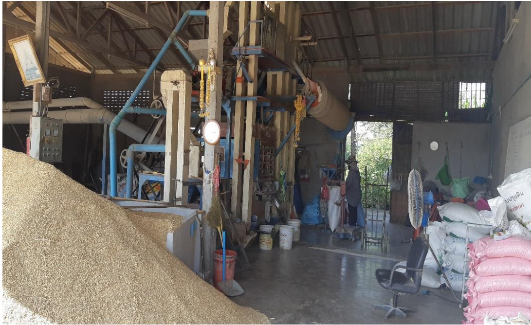
เครื่องสีข้าวของกลุ่ม