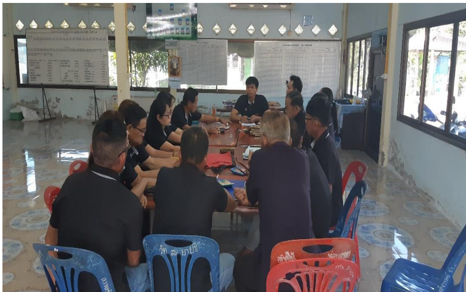
ประชุมคณะกรรมการประจำเดือน