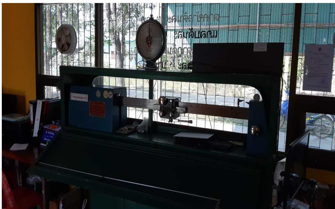
เครื่องชั่งน้ำหนัก