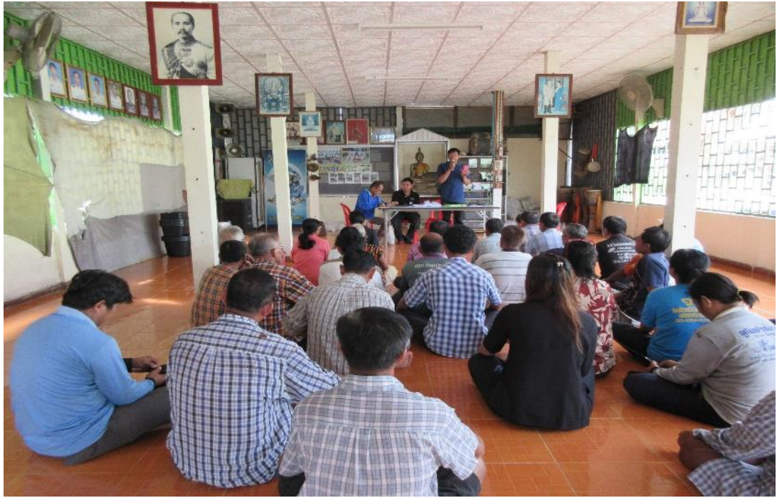
ได้รับคำแนะนำและประสานงานจัดตั้งเป็นกลุ่มนาแปลงใหญ่