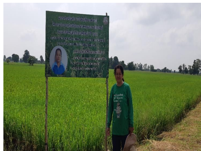
แปลงสาธิตเทคโนโลยีการผลิตข้าวคุณภาพดี