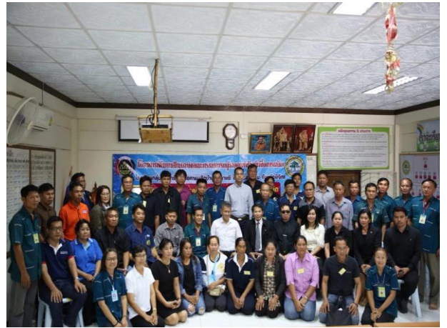
หลักสูตรการเรียนรู้การจัดทำบัญชี และการบริหารจัดการกลุ่ม