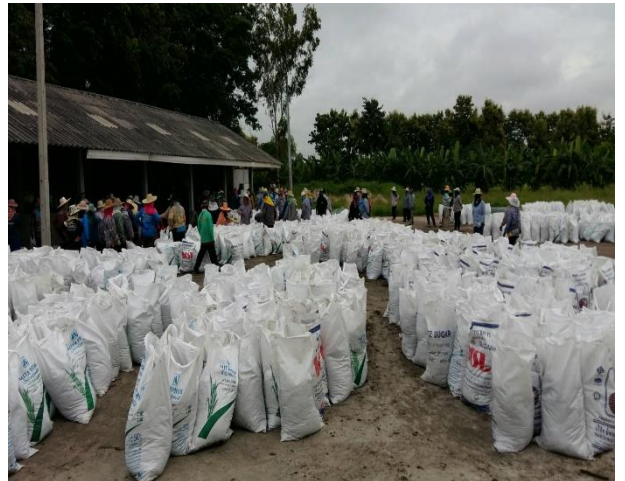
ผลิตปุ๋ยหมักโดยจ้างแรงงานในชุมชน

๒.๒) โครงการเพิ่มศักยภาพการผลิตสินค้าเกษตรด้วยสารชีวภัณฑ์ งบประมาณ ๘๐๕,๑๒๐ บาท ดำเนินการจ้างแรงงานเกษตรกร ผลิตสารชีวภัณฑ์ และส่งเสริมการใช้ในพื้นที่ เป็นการสร้างรายได้และส่งเสริมให้เกิดการลดต้นทุนการผลิต