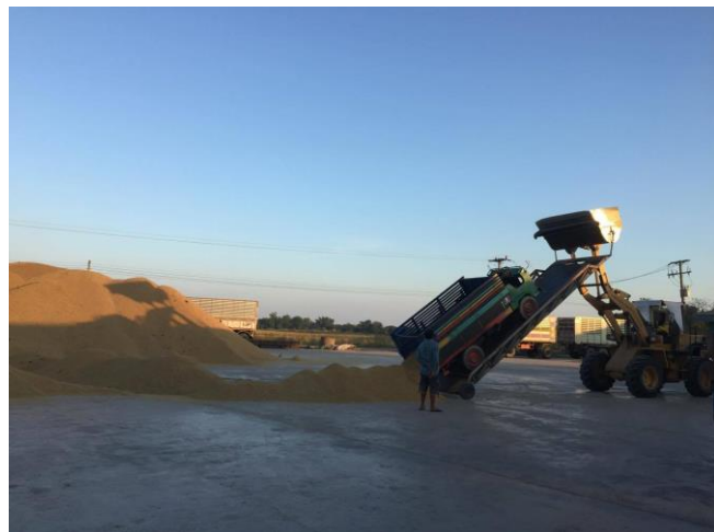
รับซื้อข้าวเปลือกจากสมาชิก