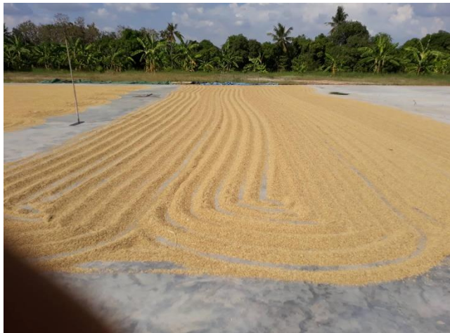
ผลิตเมล็ดพันธุ์ข้าวคุณภาพดีเพื่อกระจายให้แก่สมาชิก