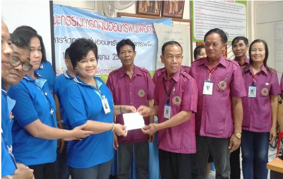
คณะกรรมการและสมาชิกผ่านการอบรมจากโรงเรียนกลุ่มออมทรัพย์ฯ