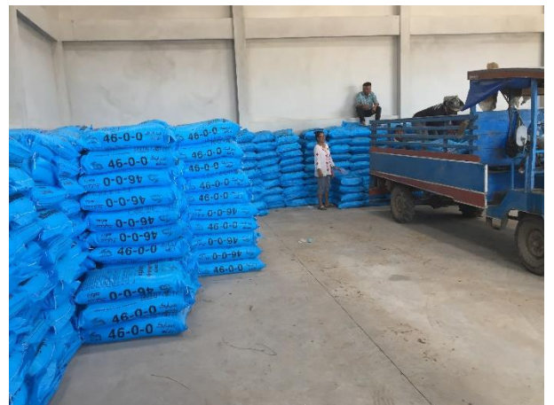
จัดหาปัจจัยการผลิตให้สมาชิก