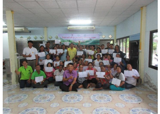
เป็น ศพก.เครือข่ายในการจัดอบรมถ่ายทอดความรู้ให้แก่เกษตรกร