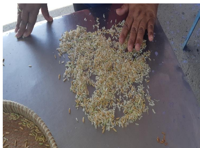
แม่ค้าโรงสีมาร่วมกำหนดราคา ตรวจสอบคุณภาพผลผลิต โดยคณะกรรมการกลุ่มร่วมในการตรวจสอบ