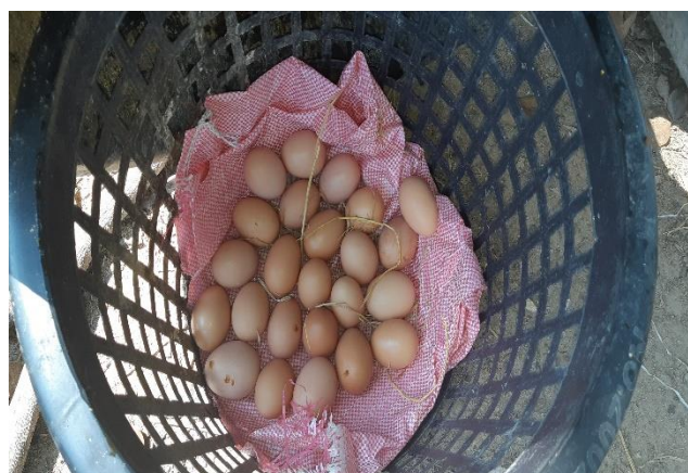
ฟาร์มชุมชนบ้านสระยายชี