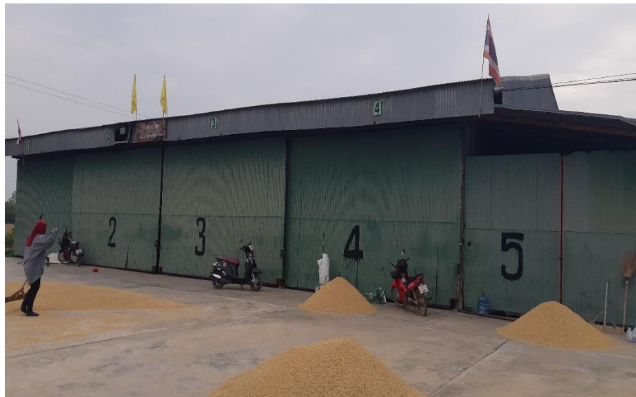
ฉางเก็บข้าวของกลุ่ม

๓.๕ ปี พ.ศ. ๒๕๔๘ สร้างฉางข้าว ขนาด ๖๐๐ ตัน งบประมาณสนับสนุนจากจังหวัดและ เงินทุนเรือนหุ้นของสมาชิก