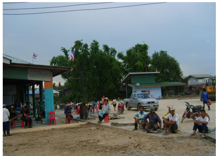
สร้างลานตากข้าว โดยแรงงานเกษตรกรในชุมชน