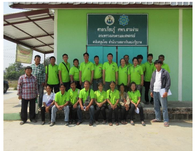
ร่วมประชุมคณะกรรมการ ศพก. อำเภอสามง่าม เพื่อวางแผนการพัฒนาาร่วมกัน