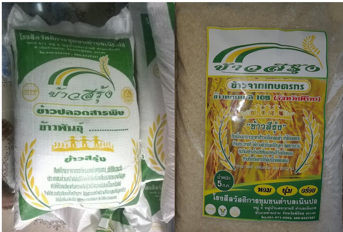
ผลิตภัณฑ์ข้าวสารของกลุ่ม