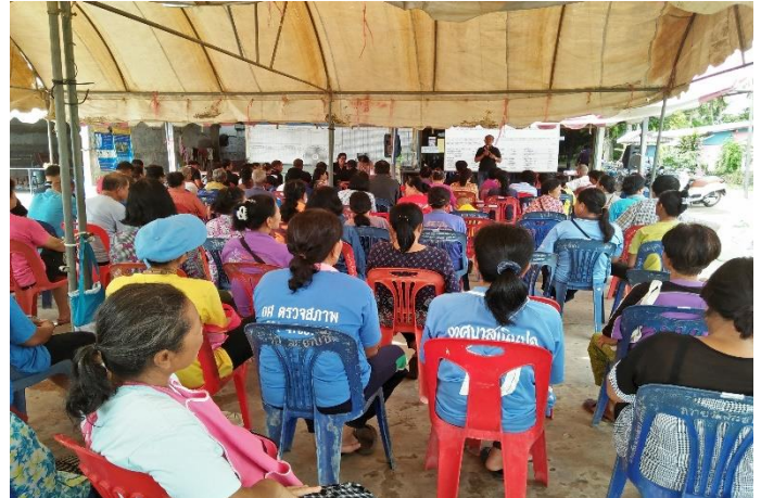
จ่ายเงินปันผลให้สมาชิก