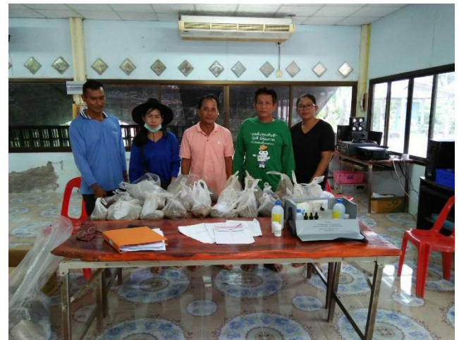
ให้บริการตรวจวิเคราะห์ดินแก่สมาชิก