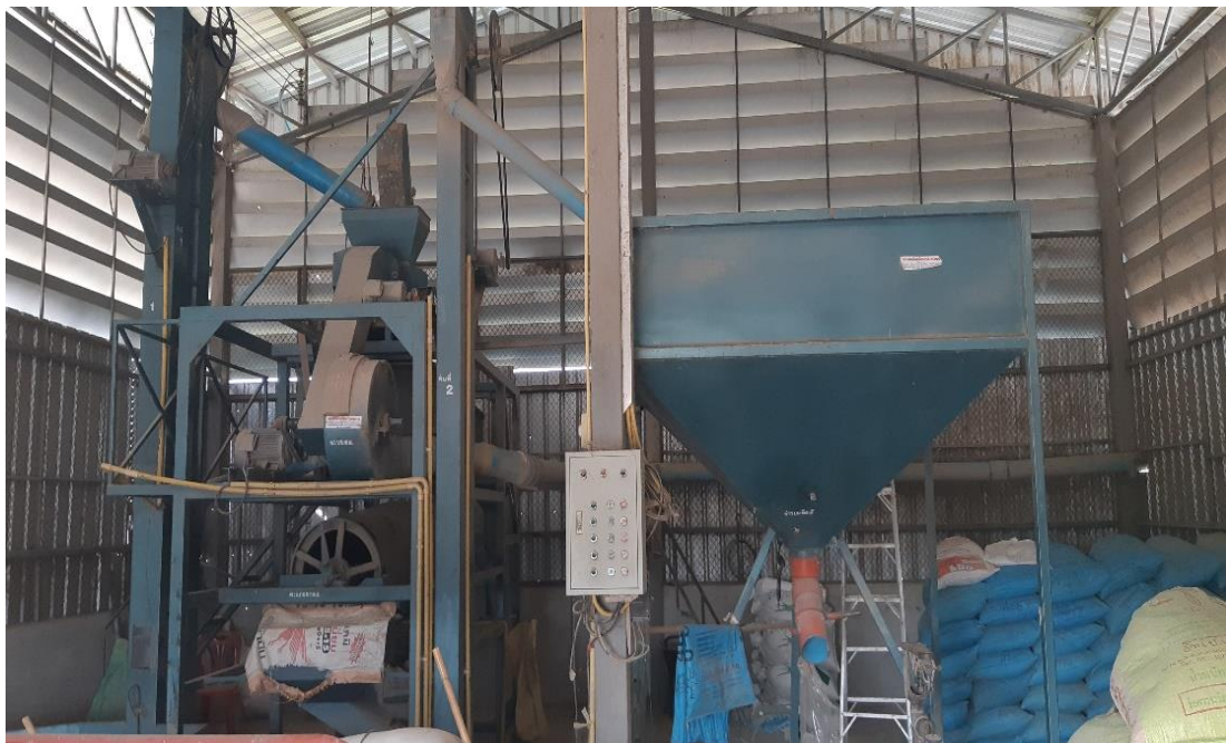
เครื่องคัดเมล็ดพันธุ์ข้าว