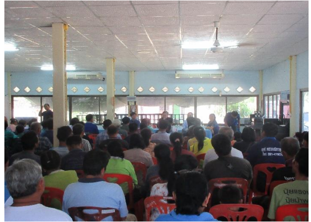
ทำสัญญาซื้อขายกับสมาคมผู้ส่งออกข้าว

๑๑.๕ การดำเนินกิจการโรงสีชุมชน มีการจ่ายค่าตอบแทนให้แก่ผู้ดำเนินงาน หรือรับจ้างแรงงาน ดังนี้