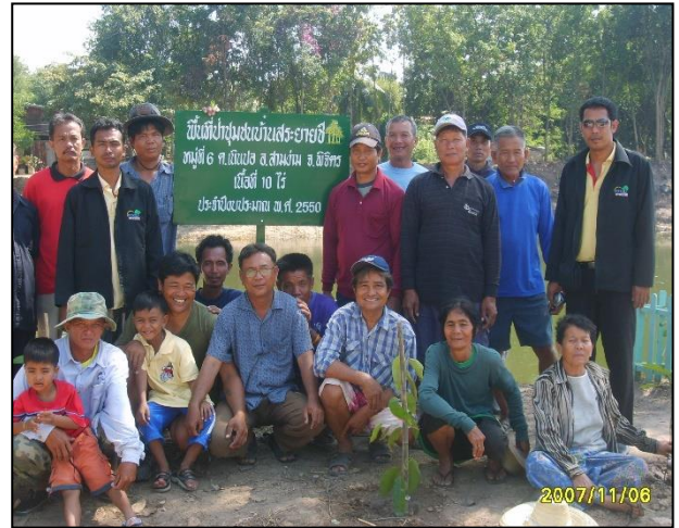
กลุ่มเกษตรกรทำนาเนินปอ

๑๓.๕ ศูนย์เรียนรู้การเพิ่มประสิทธิภาพการผลิตสินค้าเกษตรอำเภอสามง่าม มีความเชื่อมโยงกัน โดยโรงสีสวัสดิการชุมชน ต.เนินปอ เป็นศูนย์เครือข่าย ในการพัฒนาเกษตรกร ถ่ายทอดความรู้ และแหล่งเรียนรู้ให้แก่เกษตรกรในชุมชน