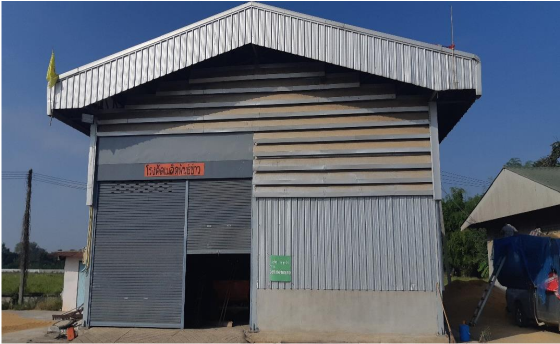
อาคารจัดเก็บเครื่องคัดเมล็ดพันธุ์