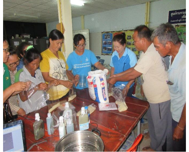
สมาชิกเรียนรู้การใช้สารชีวภัณฑ์เพื่อลดต้นทุนการผลิต