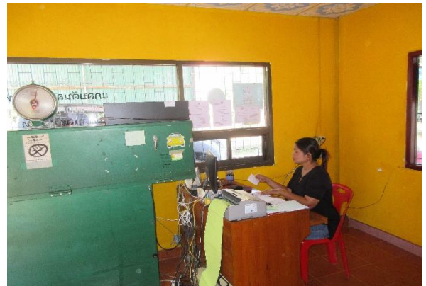
เสมียนประจำวัน และเสมียนควบคุมกิโลซัง

๑๑.๖ การดำเนินกิจการอื่น ๆ เพื่อสร้างรายได้ให้กลุ่ม