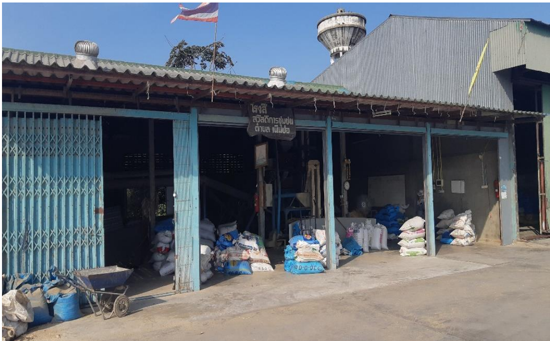
อาคารโรงสี