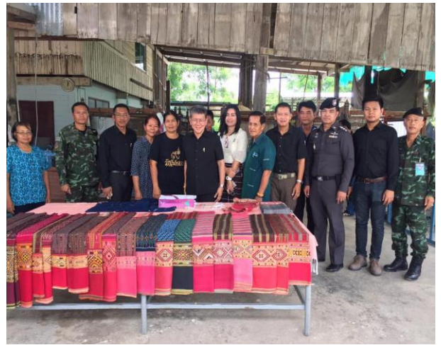
ผู้ว่าราชการจังหวัดพิจิตรตรวจเยี่ยมกลุ่มทอผ้าตีนจก