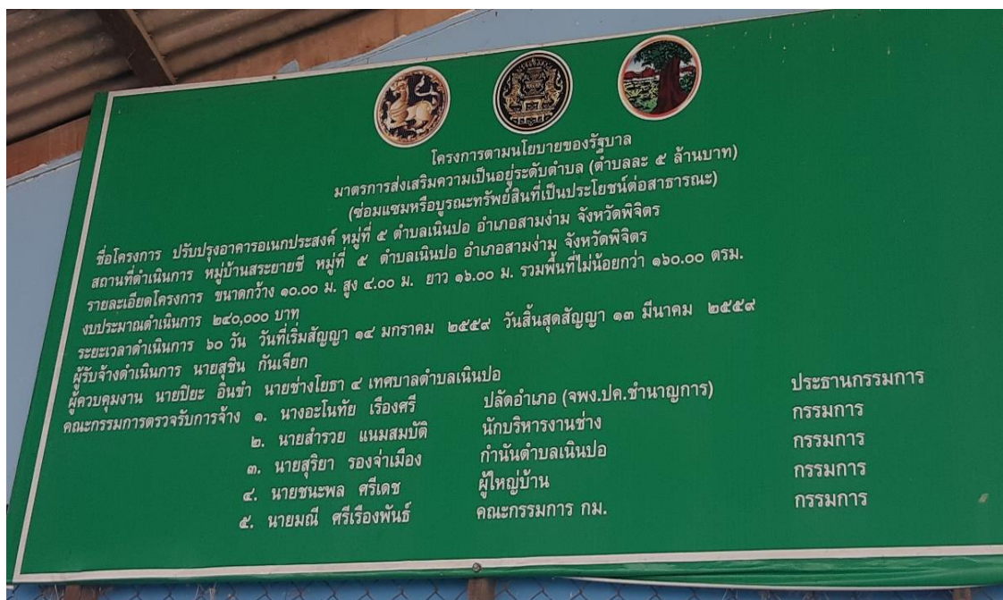
งบประมาณต่อเติมห้องประชุม