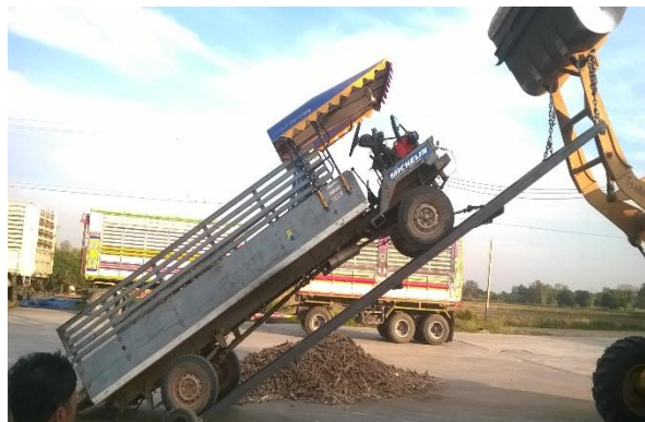
รับซื้อมันสำปะหลังของเกษตรกรในชุมชน