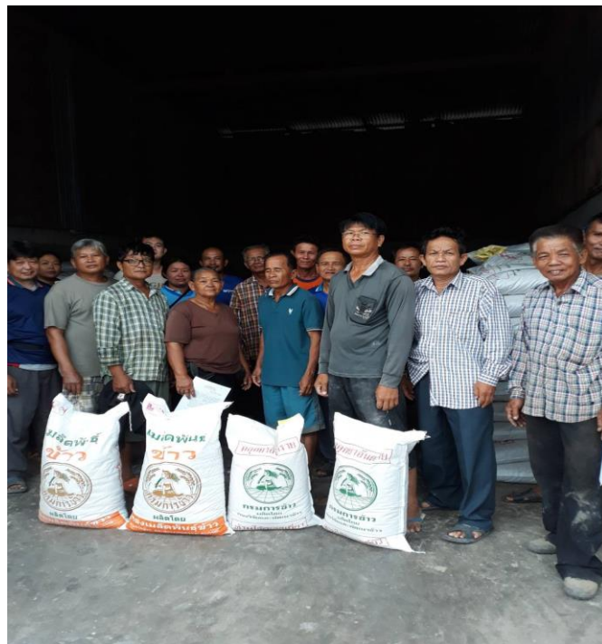
ศูนย์วิจัยข้าวพิษณุโลก สนับสนุนเมล็ดพันธุ์ข้าวให้กับกลุ่ม