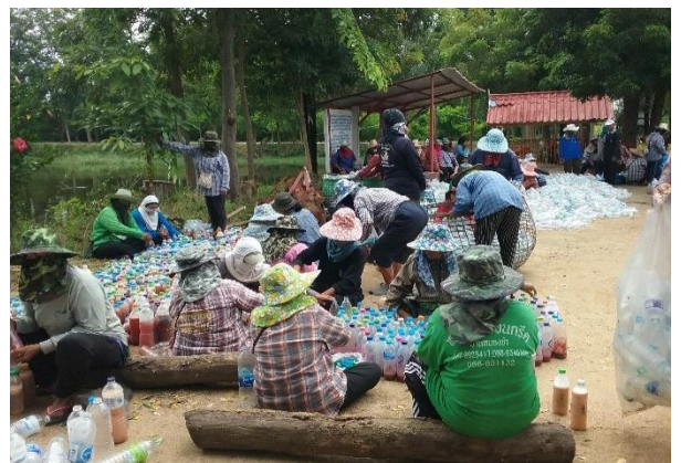
ผลิตสารชีวภัณฑ์ ทดแทนการใช้สารเคมี เพื่อลดต้นทุนการผลิตข้าว