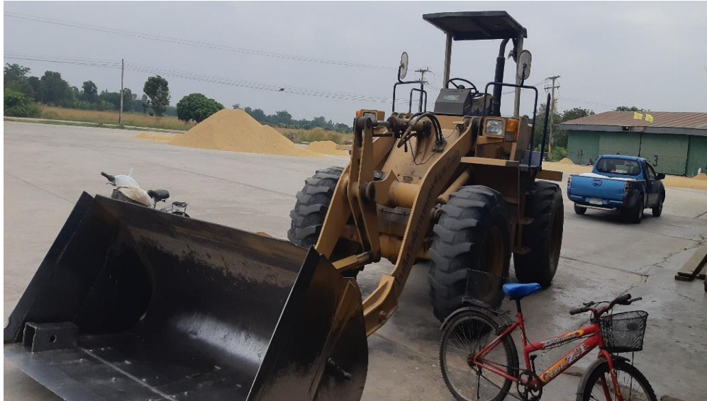
รถดักข้าวของกลุ่ม

๓.๔ ปี พ.ศ. ๒๕๔๗ ซื้อรถดักข้าวเปลือก ขนาด WA ๑๐๐ ราคา ๑,๐๔๐,๐๐๐ บาท โดยการระดมหุ้นของสมาชิกและเงินจากกลุ่มออมทรัพย์สมทบ